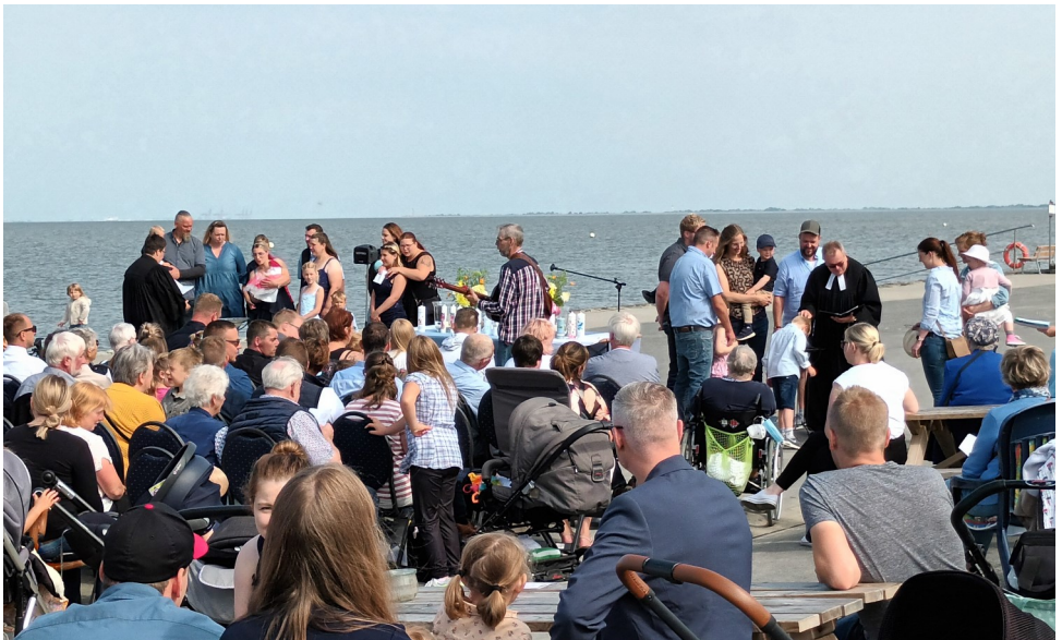
Taufest in Sehestedt 2022